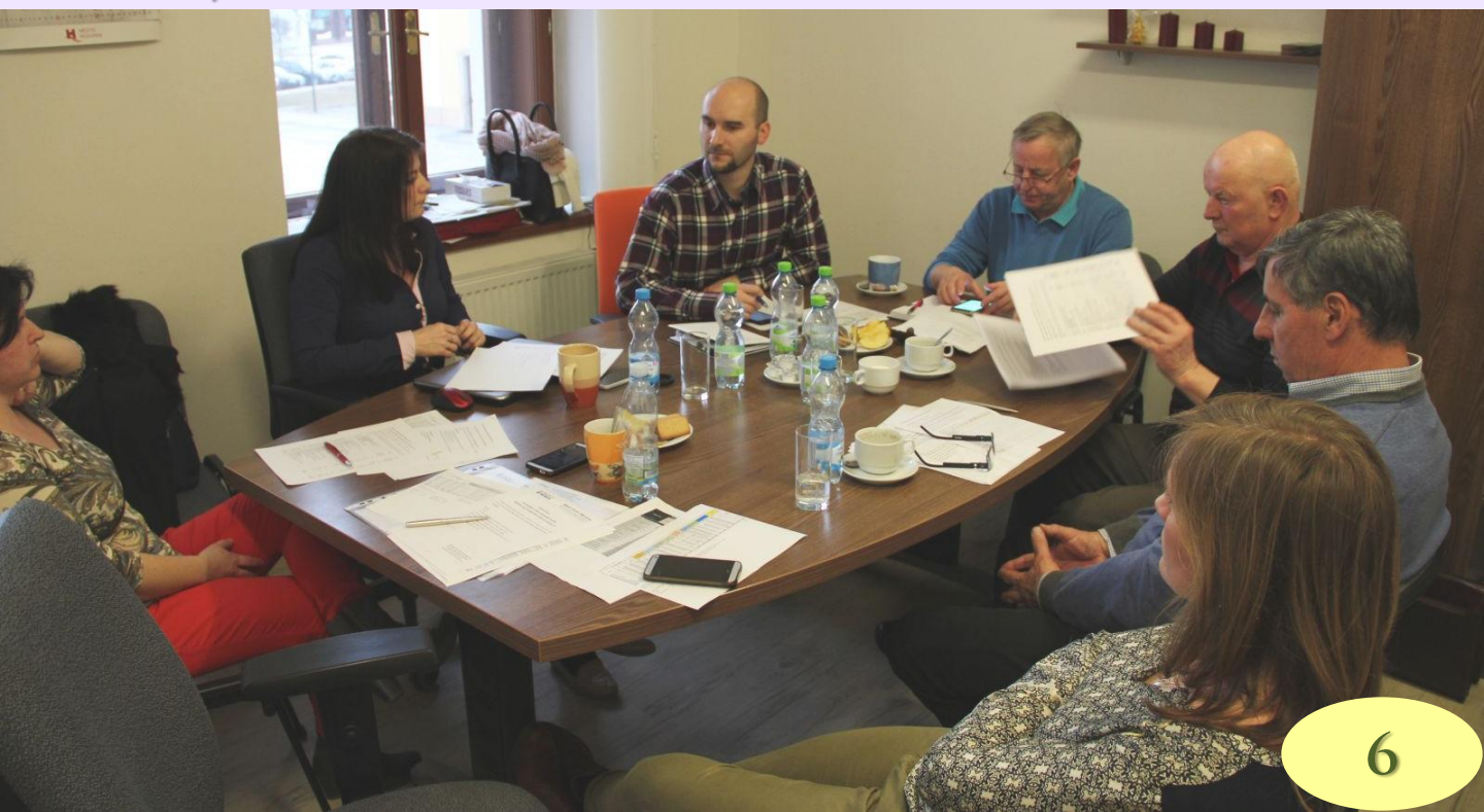
Foto: zasedání výboru MAS Dolní Morava

Výbor se schází podle potřeby, nejméně čtyřikrát do roka. Schůze výboru svolává předseda spolku MAS Dolní Morava, případně místopředseda spolku MAS Dolní Morava.