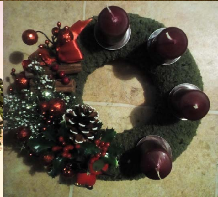
Ukázka výrobků soutěže „Zimní tvoření“